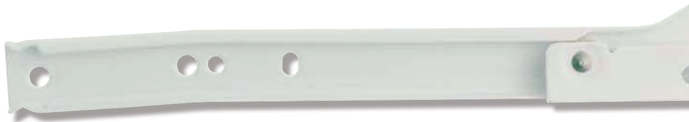
Szyna mocowana do panela bocznego